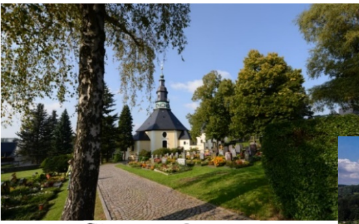
Kurort Seiffen www.seiffen.de