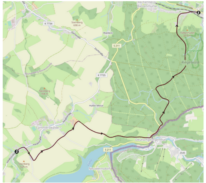
Karte: Openstreetmap, Lizenz: CC-BY-SA 4.0